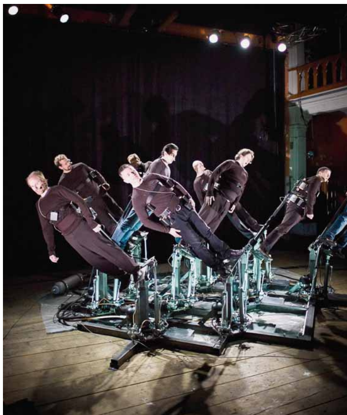
Neuf chanteurs placés sur des véris, pour un fascinant ballet sonore.