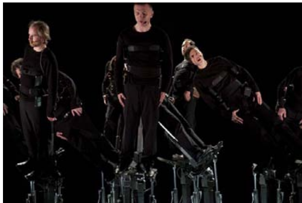
『Pendulum Choir』 ©Cod.Act

そこで、たっぷりの質問を送ってみることにしました。作品のこと、Cod.Actのこと、活動のこと、そしてこれからのこと。