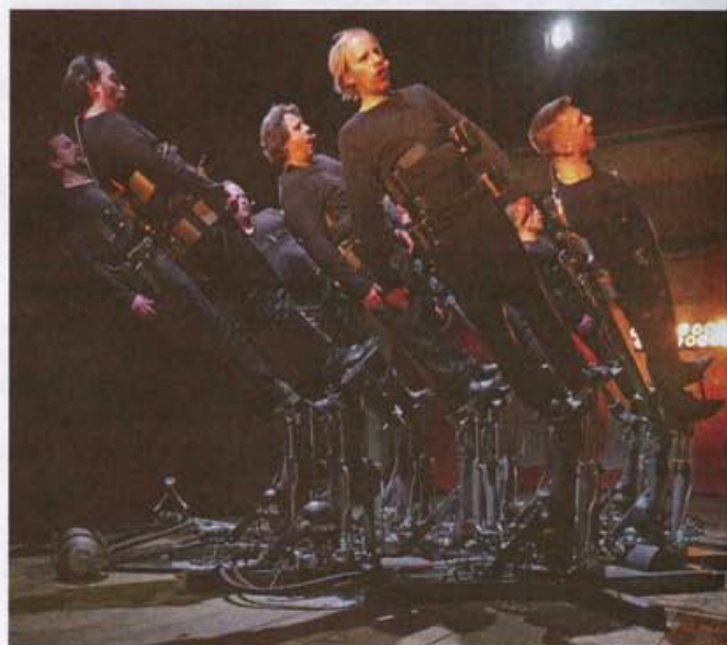
«Mettre le corps sous contrainte pour obtenir une évolution de la voix».

Il y a des plateformes qui sont articulées sur deux axes avec des vérins hydrauliques et qui peuvent