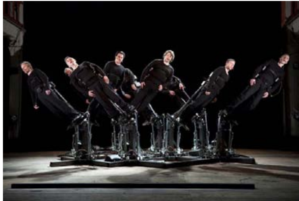
Pendulum Choir ©Cod.Act

震災から1ヶ月後の4月中旬、日本の様子を心配するメッセージとともにメールでとどいた新作の画像と動画のwebリンク。送り主は2月に出会ったスイスのアーティスト、アンドレ・デコスデル。新作のプロジェクトを切り取った実写も無い画像の迫力から、なんだか元気をもらったことを思い出します。