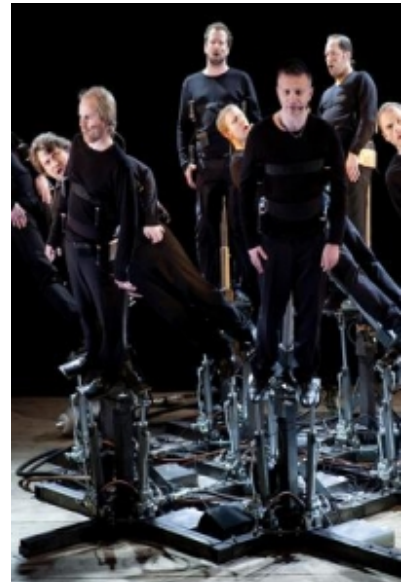
Ça balance pour les chanteurs de Pendulum Choir!

, créé la semaine dernière dans la cité horlogère, qui installe pour quatre jours à Vevey ses deux tonnes et demie de plates-formes métalliques et de vérins hydrauliques et ses 9 chanteurs harnachés à la machine tentaculaire. Explications avec André Décosterd, le compositeur de l'équipe: « Pendulum Choir fait du chœur un corps organique respiratoire, une vague vivante, un poumon géant qui chante pendant cinquante minutes sur le thème de la respiration, de la suffocation et de l'extase.»